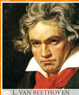
L. VAN BEETHOVEN