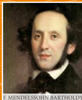
F. MENDELSSOHN BARTHOLDY